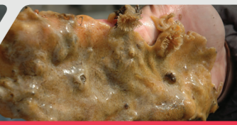
Chwistrell fôr carped Carpet sea squirt

Gallwch ganfod mwy am blanhigion ac anifeiliaid ymosodol a sut i'w hatal rhag ymledu yn: Find out more about invasive plants and animals and how you can help to stop the spread: