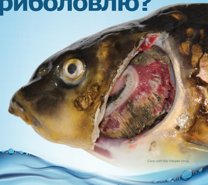
Carp with Koi Herpes Virus

Хвороби та інвазивні рослини та тварини вбивають рибу та створюють перешкоди на водних шляхах