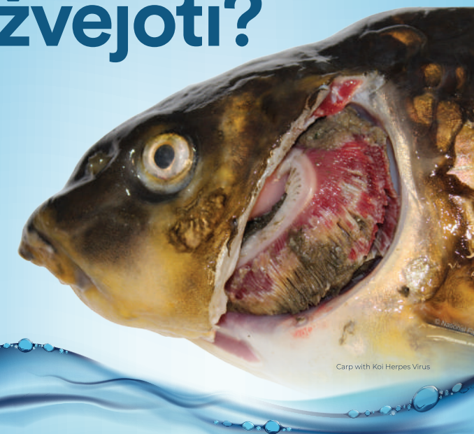
Carp with Koi Herpes Virus

Ligos ir invaziniai augalai ir gyvūnai žudo žuvis ir blokuoja vandentakius. Saugokite aplinką ir žvejybą, kuria mėgaujate, kad jūsų įranga būtų be invazinių, svetimų augalų, gyvūnų ir ligų.