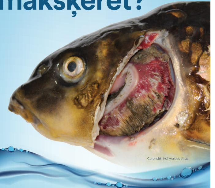
Carp with Koi Herpes Virus

Slimības un invazīvi augi un dzīvnieki nogalina zivis un nosprosto ūdensceļus. Pasargājiet vidi un makšķerēšanu, kas jums tik ļoti patīk, parūpējoties, lai jūsu aprīkojumā nebūtu invazīvi svešzemju augi, dzīvnieki un slimības.